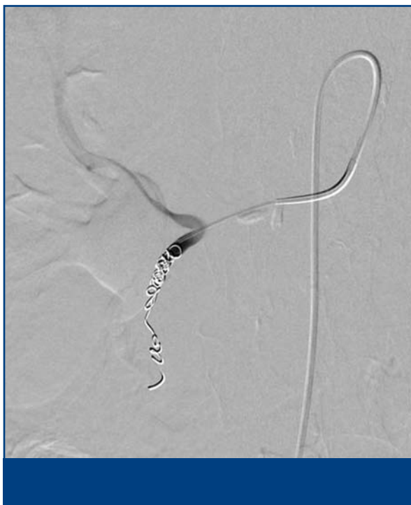
Figuur 2. Angiografisch beeld van de selectieve afsluiting van de a. gastroduodenalis met behulp van coils.

aberrante vaten toch extrahepatische depositie is ten gevolge van redistributie. Indien nodig worden aanvullend vaten afgesloten. Het voorgaande is dé kritieke stap van de gehele procedure omdat eventuele depositie van ^{90}\text{Y} -microsferen in maag of duodenum kan leiden tot een ernstige gastritis/duodenitis, of zelfs ulcera en persisterende bloedingen.