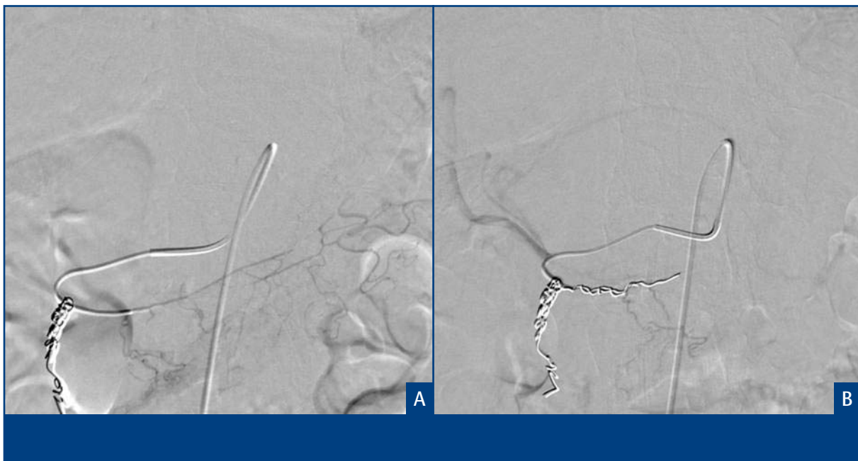
Figuur 3. Angiografische beelden van een selectieve afsluiting van de a. gastrica dextra, welke afkomt uit de origo van de a. hepatica sinistra, met behulp van coils.

entegen was de incidentie van graad 3- en 4-toxiciteit gelijk. In de 2 e gerandomiseerde studie, van Van Hazel et al., gepubliceerd in 2004, werden patiënten behandeld met harsmicrosferen (eenmalig) in combinatie met 5-FU/LV (iedere 4 weken, gedurende 5 dagen) of met 5-FU/LV alleen. 23 De studie omvatte slechts 21 patiënten omdat deze vroegtijdig werd gestaakt. De reden hiervan was dat de effectievere FOLFOX- en FOLFIRI-protocollen beschikbaar kwamen. Ondanks de kleine omvang van de studie, waren de verschillen in het progressievrije interval en de mediane overleving significant. Het progressievrij interval was respectievelijk 18,6 maanden voor de combinatiarm en 3,4 maanden voor de 5-FU/LV-arm ( p < 0,001 ), en de mediane overleving was 29,4 maanden versus 12,8 maanden ( p = 0,02 ). Er was significant meer graad 3- en 4-toxiciteit in de combinatiegroep. Hierbij waren 2 complicaties, levercirrose ( n=1 ) en een leverabces ( n=1 ), met zekerheid gerelateerd aan de 90 Y-RE. Niettemin werd de toxiciteit acceptabel bevonden. De resultaten van de studies van Gray en Van Hazel zijn hoopgevend, want deze tonen significante verschillen wat betreft respons, progressievrij interval en mediane overleving. Een belangrijke beperking van deze studies is dat het kleine aantallen patiënten betreft. Er zijn inmiddels fase I-studies uitgevoerd waarbij 90 Y-RE werd gecombineerd met FOLFOX, irinotecan of FOLFIRI. Deze